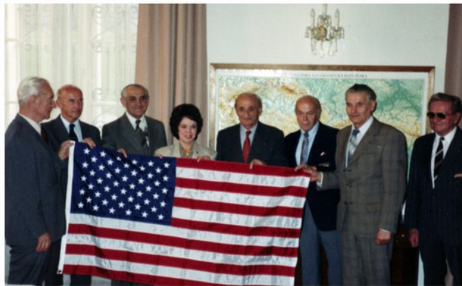
Delegace čs. zahraničních vojáků u americké velvyslankyně v Praze paní Shirley Temple Black (Rudolf Pernický stojí 4. zprava).