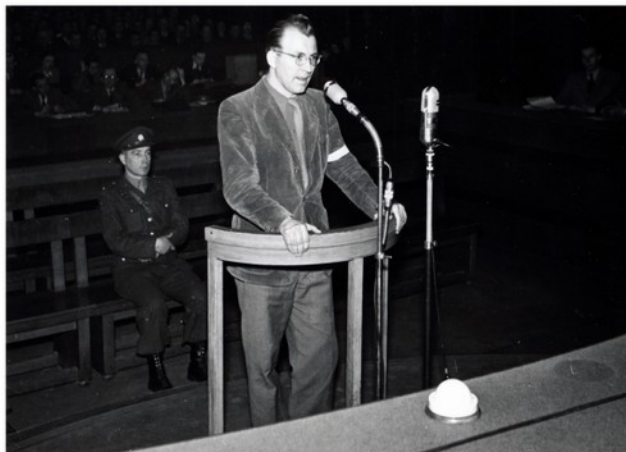
Nechybělo mnoho a životní pout' Rudolfa Pernického mohla skončit stejně, jako tomu bylo v případě jeho spolupojopvníka, velitele výsadku PLATINUM-PEWTER majora Jaromíra Nechanského, který byl komunisty 16. června 1950 popraven.