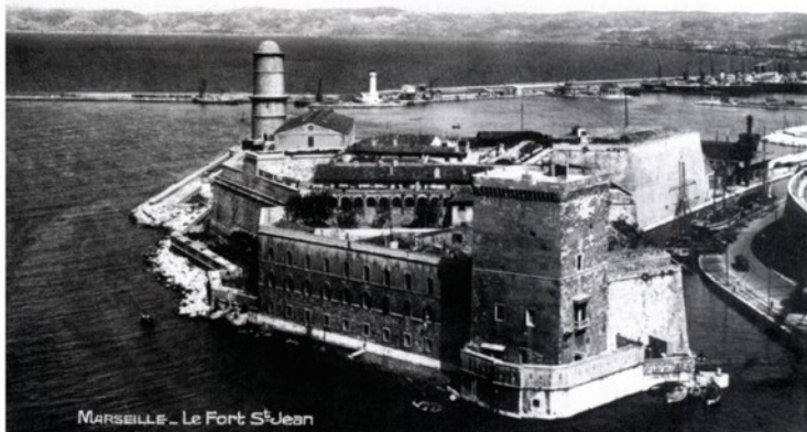
MARSEILLE - Le Fort St. Jean