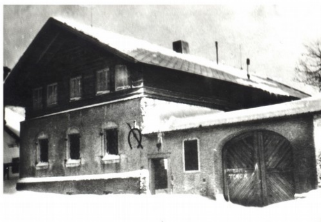
Pension Cyrila Musila ve Studnici u Nového Města na Moravě se stal spolehlivou základnou výsadek TUNGSTEN.