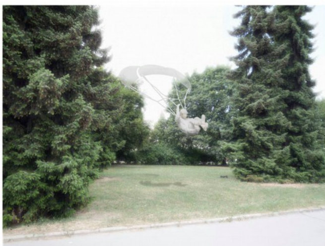
model č. 3 - Martina Víková