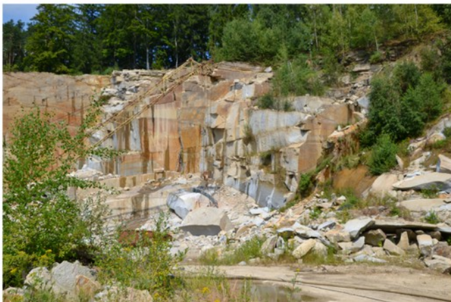
Lom Mrákotín - vytěžení kamene pro pomník