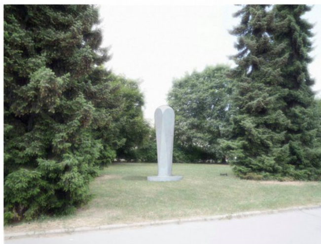
model č. 2 - Petr Lacina