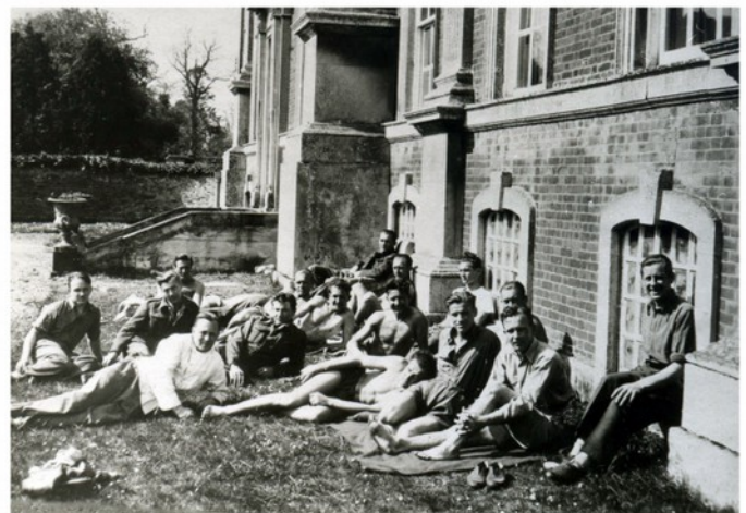
Skupina budoucích příslušníků čs. paraskupin před zámečkem Chicheley Hall v létě 1943.

Obyčejně jsem s nimi jezdil i do jihozápadní Anglie, kde probíhal zpravodajský kurz. Učilo se tam, jak budovat ilegální organizace, jaké zásady dodržovat při konspiraci, sledování osob, unikání z obklíčení i přežití ve volné přírodě.