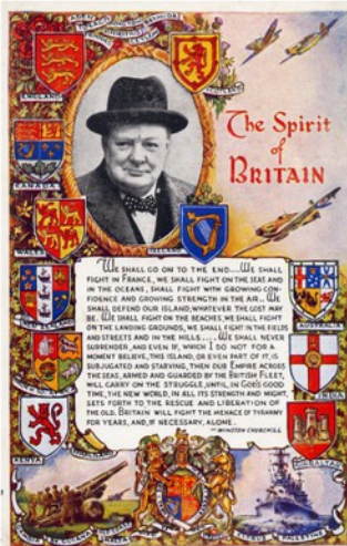
„The Spirit of Britain“ dobová pohlednice s textem historického projevu Winstona Churchilla.