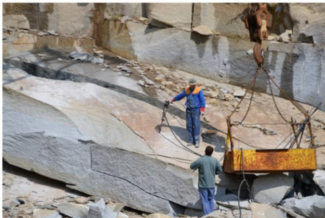
Přípravy a realizace pomníku z mrákotinské žuly