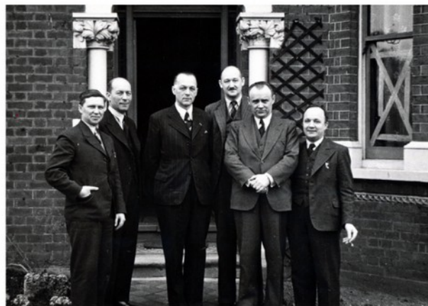
Dne 1. srpna 1940 vznikla v Londýně zvláštní skupina MNO (zpravodajská ústředna), v jejímž čele stanul plk. František Moravec (2. zprava). Díky informacím, jimiž disponovala, si získala mimořádný respekt Spojenců. Zajišťovala i výsadekové operace na území okupované vlasti.