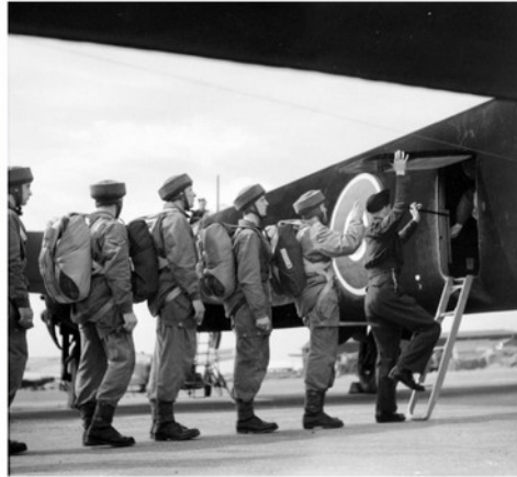
Na teoretické základy seskoku padákem, jeho balení, balení zásob do speciálních balíků i kontejnerů, navazovalo to nejpodstatnější: praktické seskoky.