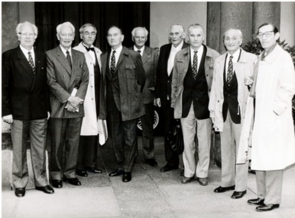
Na dlouhá čtyři desetiletí komunistické diktatury zmizeli čs. parašutisté ze Západu z dějin Československa. Změna nastala teprve po listopadu 1989. V říjnu 1990 přijal delegaci čs. parašutistů na Hradě prezident republiky.