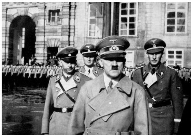
V noci ze 14. na 15. března 1939 oznámil v Berlíně Adolf Hitler prezidentovi dr. Emilu Háchovi, že v šest hodin ráno zahájí německá armáda obsazování českých zemí. Dnes 16. března 1939 byl vydán výnos o vzniku Protektorátu Čechy a Morava.