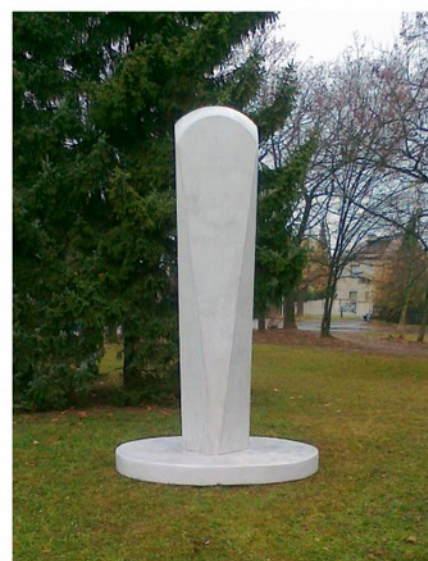
Vítězný návrh studenta Petra Laciny