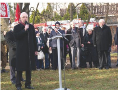
Promluva Prof. Ing. Jiřího Drahoše - předseda Akademie věd ČR