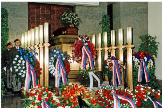
Pohřeb generála Rudolfa Pernického proběhl se všemi vojenskými poctami.