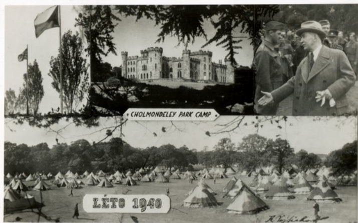
Pohlednice improvizovaného čs. vojenského tábora v Chalmondeley u Chesteru.