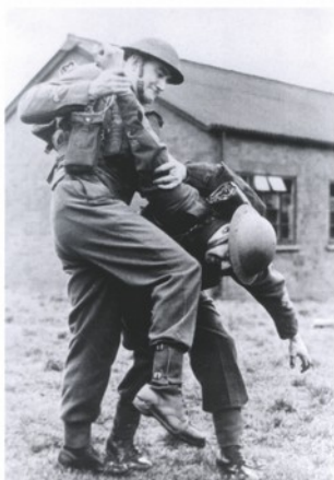
Součástí kursů byla i sebeobrana, pro niž se vžil „mirumilovný“ odborný termín „Silent-Killing“ (tiché zabíjení). Dovoleno bylo vše.