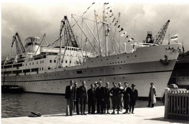
Skupina čs. dobrovolníků před polskou lodí Chrobry, která je na konci července 1939 přepravila do Francie.

Nebo jsem tam v jedné hospodě zažil, jak na stůl vyskočil polský poručík a křikl: „Za čtrnáct dní budem v Berlíně!“ Pro sebe jsem si říkal: my už jsme zažili ten plechový cirkus – jak jsme říkali wehrmachtu – když k nám vtrhli, a víme, co mají. Chlapci, ti vás roztočí tak, že nebudete vědět, kde jste! A taky roztočili. Tou dobou jsem však již v Polsku nebyl. Přes čs. tábor v Malých Bronovicích u Krakova jsem byl poslán do Francie, kam jsem spolu s dalšími odplul na konci července 1939 na lodi Chrobry.