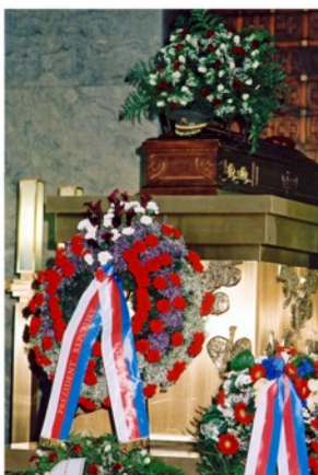
Před generálovou rakví nechyběl ani věnec od prezidenta republiky.