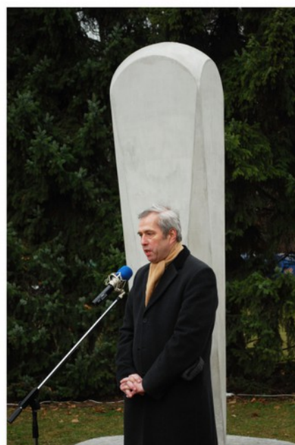
Syn generálmajora Rudolf Pernický mladší