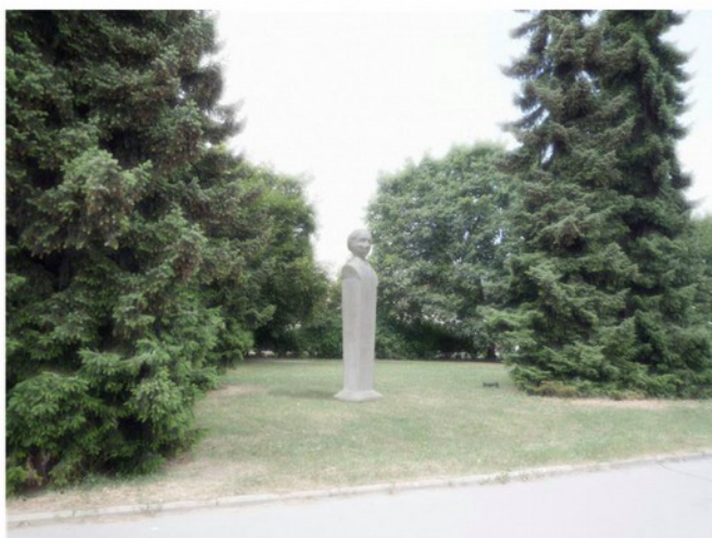
model č. 1 - Lukáš Nývlt