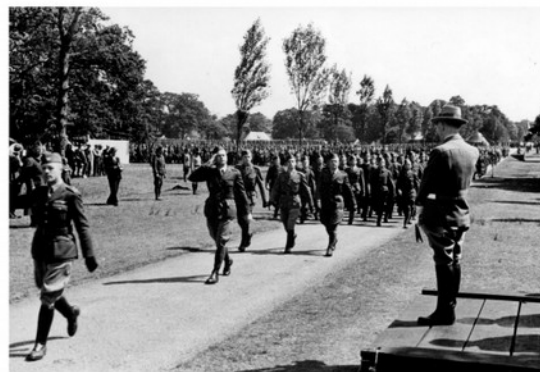
Slavnostní přehlídka čs. jednotek 26. července 1940 před dr. Edvardem Benešem v Chalmondeley.