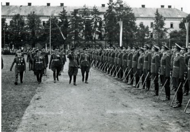
V neděli 14. srpna 1938 proběhlo ve Vojenské akademii v Hranicích slavnostní vyřazení nových důstojníků čs. armády, kteří vzápětí zamířili ke svým útvarům.