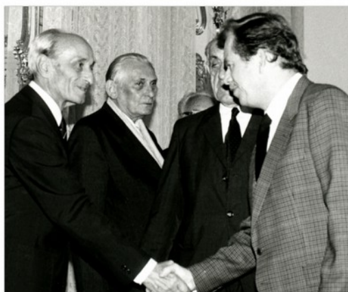
Setkání Václava Havla a Rudolfa Pernického na Pražském hradě 4. října 1990.