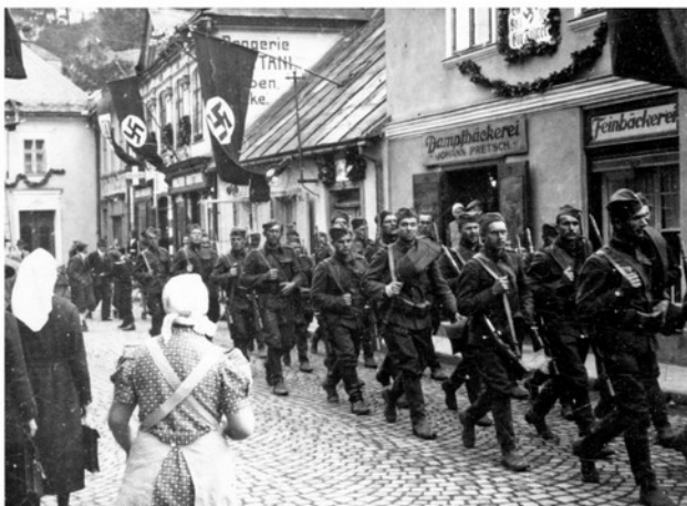
Na místo rozkazu k boji rozhodli čs. politici 30. září 1938 o podrobení se mnichovskému diktátu. K boji připravená a odhodlaná čs. armáda byla donucena ustoupit bez boje (na snímku opouštějí čs. vojáci Fulnek).