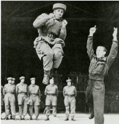
Na kurs útočného boje ve Skotsku bezprostředně navazoval týdenní parakurz, který se konal na STS 51 sídlici na letišti Ringway u Manchesteru.