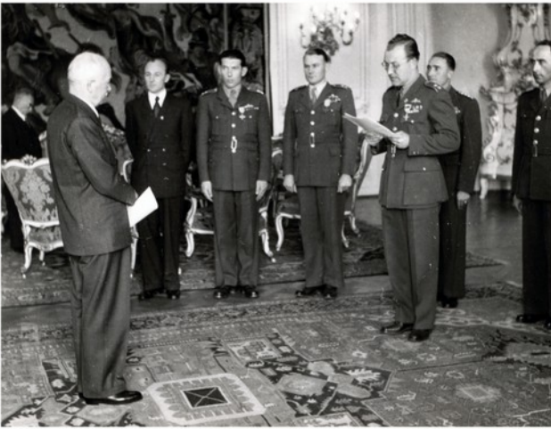
Z 98, kteří byli vysazeni ze Západu do vlasti, se jich konce války nedožilo 49. Padl každý druhý... K tomu je třeba přičíst i desítky jejich rodinných příslušníků a stovky statečných odbojářů, kteří za poskytnutou pomoc zaplatili svými životy (na snímku je audience parašutistů u prezidenta republiky dr. Edvarda Beneše).