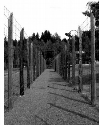
Poměry v některých koncentračních táborech komunistického režimu byly srovnatelné s těmi, které zakoušeli odbojáři v letech nacistické okupace.