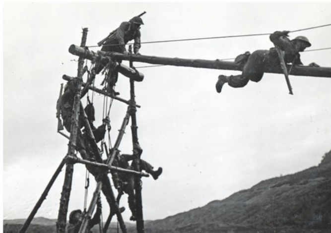
Každý frekventant kurzu strávil řadu hodin při zdolávání nejrůznějších typů překážkových drah.