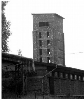
Smutně proslulá „Věž smrti“ sloužící k drcení a třídění uranové rudy z jáchymovských dolů.