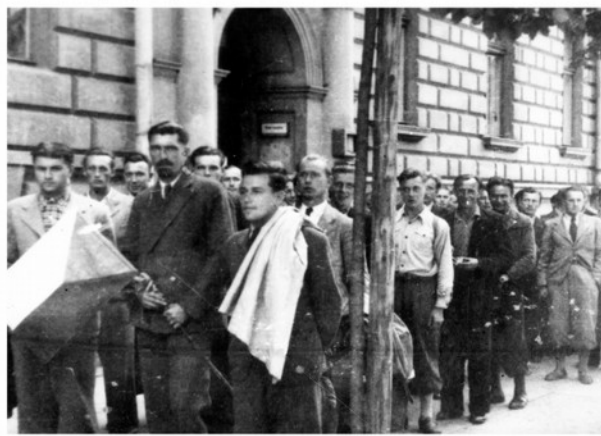
Po okupaci ČSR odešly odesly stovky mladých mužů do Polska, kde byl položen základ k obnovení naší armády. „Zahraniční vojenská skupina československá“ vznikla v polském Krakově již 30. dubna 1939.