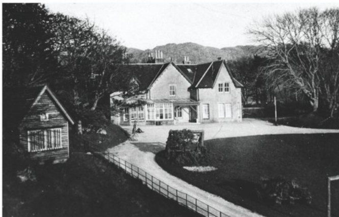
Nenápadná farma Traigh House, ležící severozápadně od Arisaigu, v níž bylo sídlo velitelství STS 25.