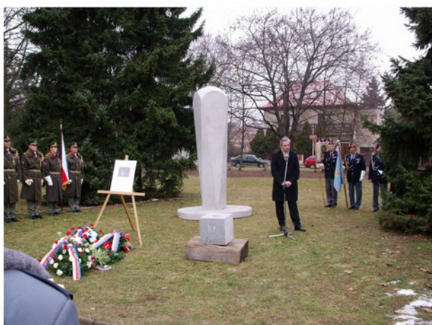
Model, základní kámen