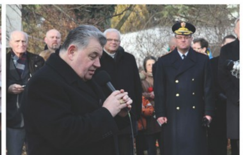
Pražský arcibiskup Kardinál Dominik Duka a jeho modlitba