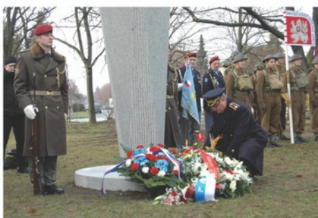
Věncem pokládá brigádní generál Zdeněk Jakubek z vojenské kanceláře prezidenta republiky