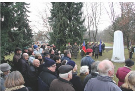
Na odhalení pomníku přihlížela i řada místních občanů