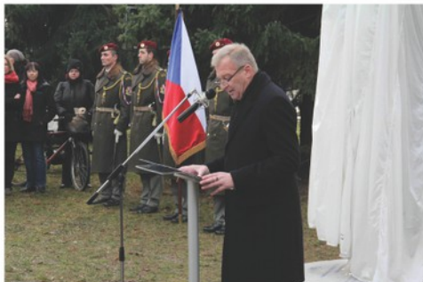
Projev ministra obrany ČR - Ing. Vlastimil Píček