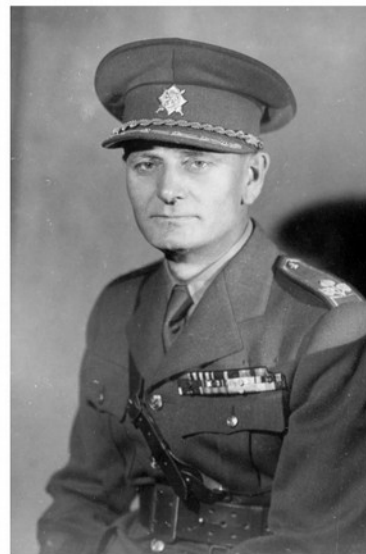
V čele Čs. vojenské kanceláře v Paříži stál od srpna 1939 generál Sergej Ingr.

A pak vlakem do jihofrancouzského Agde, kde pro nás vyklidili část tábora a kde byla organizována 1. čs. divize. Na frontu však na jaře 1940 odešly jen dva naše pěší pluky. My dělostřelci jsme to nestihli. Pak Francie kapitulovala. Museli jsme odevzdat všechny zbraně a nastoupili na britskou uhelnou loď. Ta nás převezla do Gibraltaru, kde jsme zakotvili a čekali na další transport. Pak připlul parník Viceroy of India a společně s ozbrojeným doprovodem nás převezl do Velké Británie.