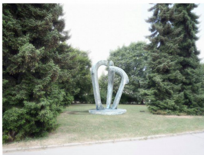
model č. 4 - Petr Mlynář