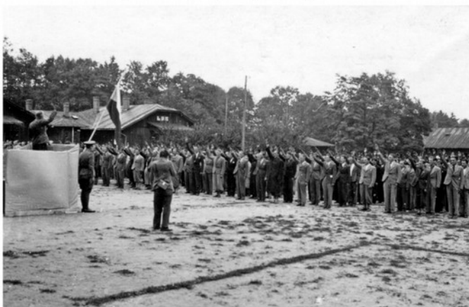
Přísaha čs. dobrovolníků ve vojenském táboře v Malých Bronovicích u Krakova.