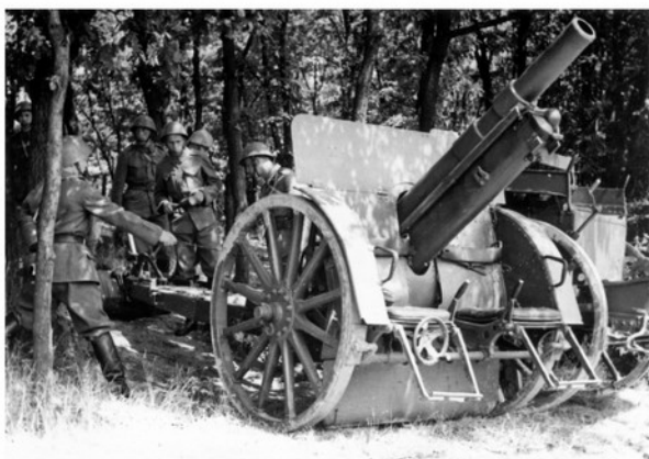
Obsluha 10 cm lehké houfnice vz. 14/19 před výstřelem (v září 1938 naše armáda disponovala šesti sty zbraněmi tohoto typu)