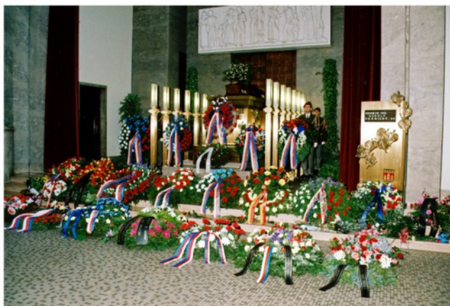
Generál Rudolf Pernický zemřel 21. prosince 2005. Poslední rozloučení se konalo v pondělí 2. ledna 2006 ve velké obřadní síni strašnického krematoria.