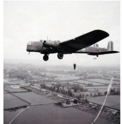
Frekventanti kursu absolvovali čtyři až pět seskoků, které byly prováděny jak za dne, tak i v noci, a to jak z bombardovacího letounu Whitley, tak upoutaného balónu.