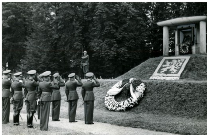
Noví poručíci čs. armády vzdávají čest památníku Vojenské akademie. Všichni bez výjimky věřili, že slova přísahy, kterou krátce před tím složili, bude-li to třeba, podepíší vlastní krví.