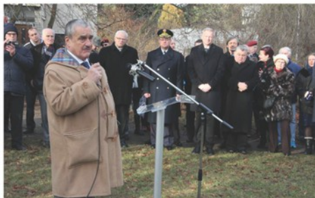
Promluva Karla Schwarzenberga - poslanec a předseda zahraničního výboru PSP ČR