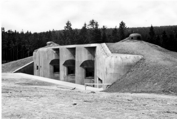
Na podzim 1938 se Rudolf Pernický objevil v užším výběru důstojníků, kteří měli být v budoucnu zařazení k osádkám dělostřeleckých tvrzí našeho opevnění. (na snímku je dělostřelecký srub R-H-S 79 „Na mytíně“ tvrže Hanička v Orlických horách).