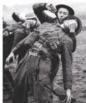
Nácvik použití dýky commandos označované někdy též jako „F-S dýka“.