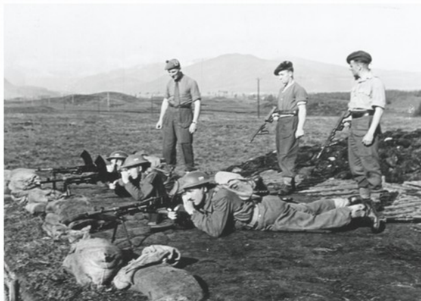
Součástí výcviku byla i střelba z lehkých kulometů Bren. Jejich obsluha nečinila čs. vojákům žádné potíže. Tato zbraň totiž vznikla z čs. lehkého kulometu vz. 26, který všichni dobře znali.