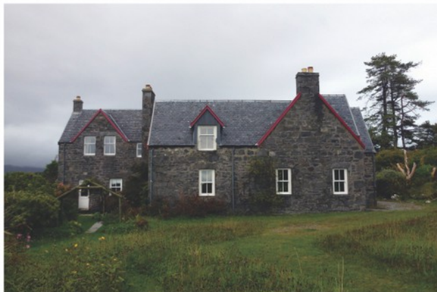
Největším objektem STS 25 byla farma Camusdarach.