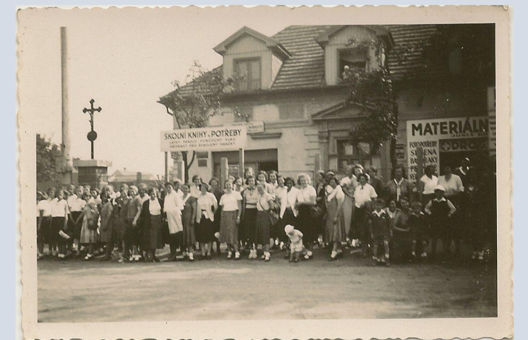
Litínový křížek, roh Suchdolské a Rostocké