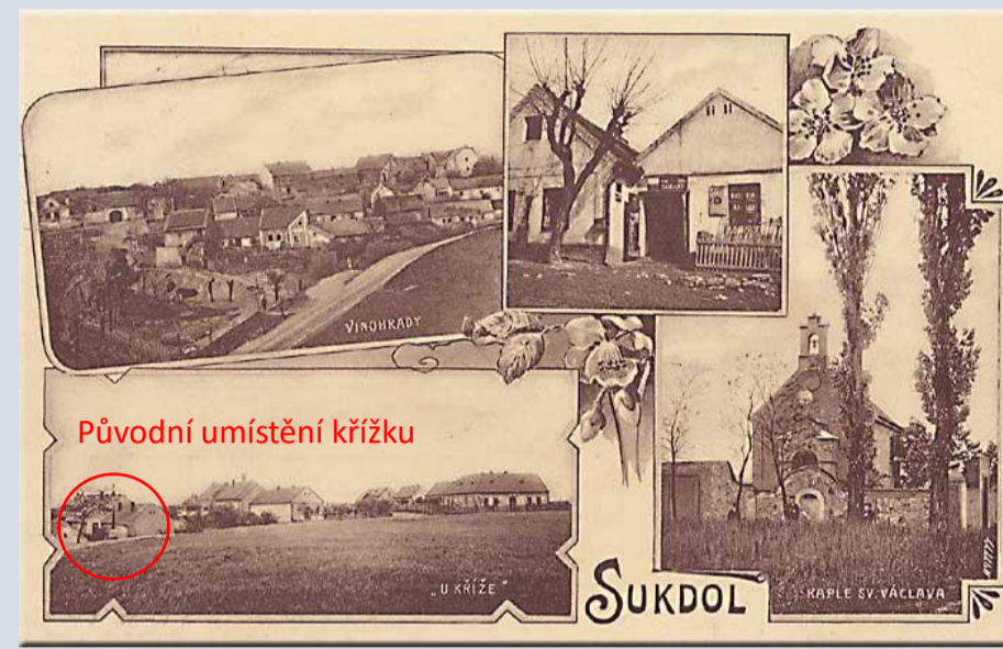
Původní umístění křížku zachyceno na pohlednici (Pohlednice)

Později (asi 1925) byl pozdějším starostou, Václavem Kouteckým (starostou 1927-28), nahrazen křížem železným. Z důvodu úprav komunikace pro zřízení autobusové linky byl železný kříž hosen do šrotu !!! [4]