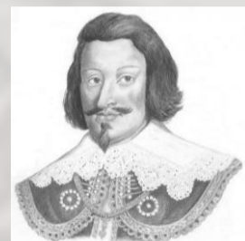
Král Ferdinand III. Habsburský 1637-1657