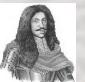
Král Leopold I. 1657-1705