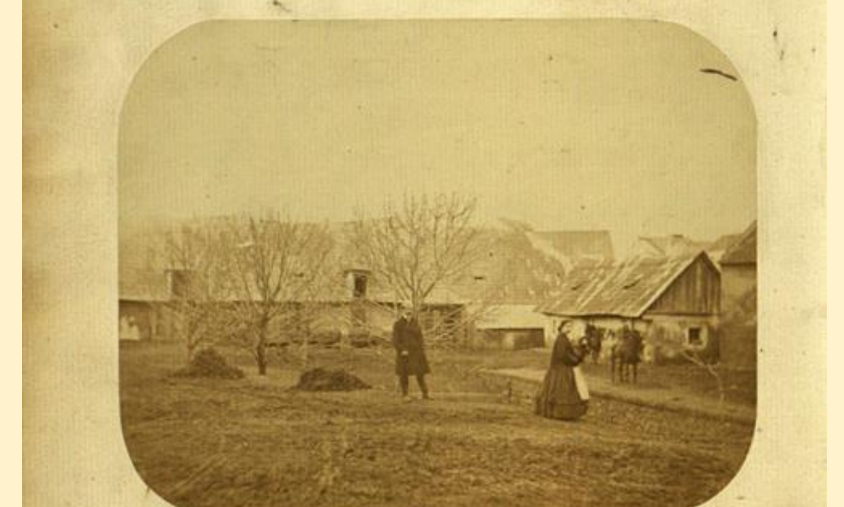
Fotografie z roku 1899

(Emauzská kronika, Národní knihovna oddělení rukopisů)