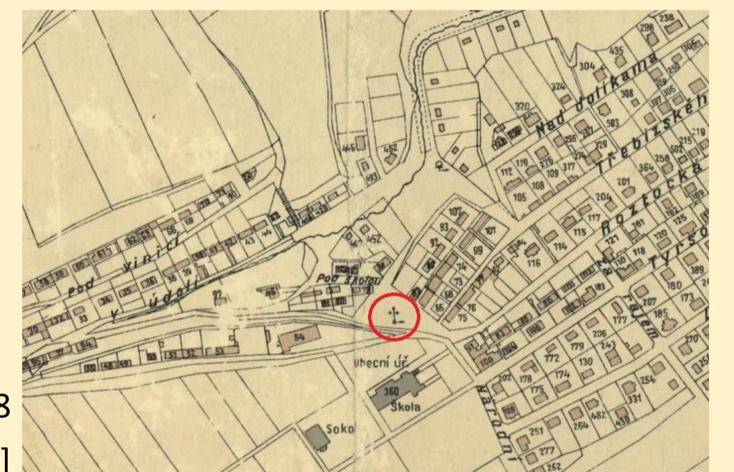
Místo bývalých hrobů na mapě z roku 1938 [29]