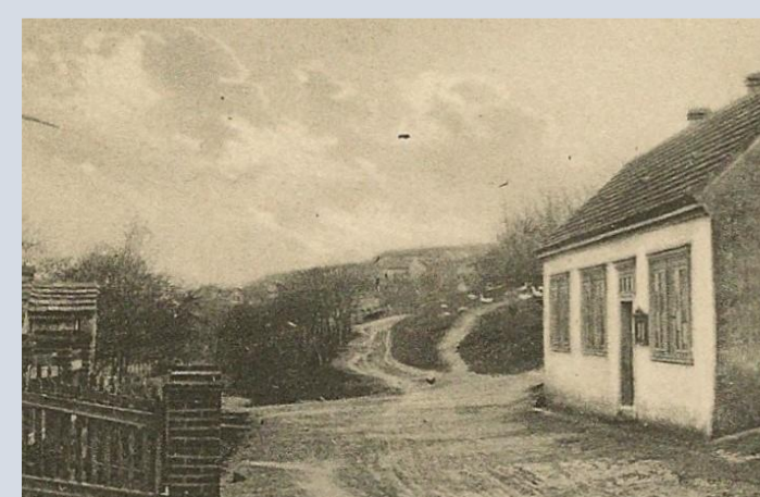
Výřez z pohlednice z roku asi 1931

1911 Obec prodává pastoušku č.p. 25. Kupuje domek č.p. 94 (na obrázku). Zde zřizuje obecní úřad, který tady působí do roku 1932. Potom se stěhuje do nově postavené obecné školy. [6]