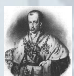
Ferdinand V Dobrotivý. 1835-1848