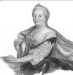
Královna Marie Terezie 1740-1780