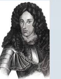
Císař a král Karel VI. 1711-1740