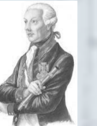
Císař a král Josef II. 1780-1790