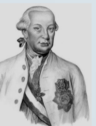
Císař a král Leopold II. 1790-1792