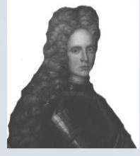
Císař a král Josef I. Habsburský 1705-1711