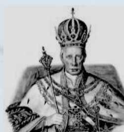
Císař a král František I. Rakouský 1792-1835