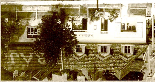
Kaderník (vlevo), Suchdolská č.p. 91.