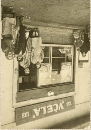
Včela, Družstevní ul. č.p. 284, 1942.