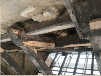
Kaple sv. Václava, odhalený krov, 2021.