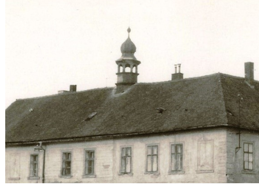
Bývalá zámekská věžička, 1971. [1]

Tesařství je profese s velmi dlouhou historií. Jedná se zejména o výrobu stavebních konstrukcí. V dávných dobách si svůj dům musel každý postavit většinou sám, byl tedy svým vlastním tesařem. Vlastní profese tesaře vznikla později. Tesařské práce byly vykonávány na hradištích, později na knížecích a velmožských dvorech, ve vznikajících městech i na vesnicích. Tesařská práce se rozvíjela a zdokonalovala v závislosti na požadavcích feudálních dvorů, hradů i měst. Zároveň se specializovalo i tesařské nářadí. Ve 14. stol. lze nalézt tesaře téměř všude. V Praze většina z nich sídlila na Novém Městě, kde byl „Dřevěný trh“. Ve středověku se tedy tesaři stali, zejména ve městech, nepostradatelnými, a to v důsledku zakládání cechů a utajování důležitých pracovních postupů. První tesařský cech byl založen až roku 1585, a to právě na Novém Městě. Tesaři byli nepostradatelní při krokových vazbách vysokých gotických střeš, pracovali však i na dřevěných konstrukcích věží. O rozsahu tesařských prací z konce 18. stol. a první pol. 19. stol. lze nalézt informace v práci Jiřího Ludvíka Hartgya „Umění lesní“ z roku 1823, kde se mimo jiné praví „Tesař jest onen řemeslník, kterémuž les nejvíce dříví vydává“. Patronem tesařů je Svatý Josef. [2] (H.B.)