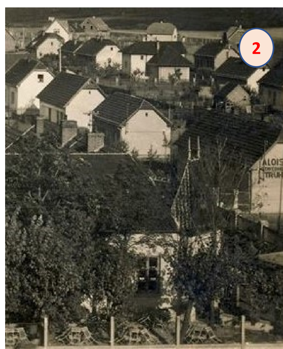
Firma Alois Čížek Novosuchdolská 178/2 (Tyršova), vlevo restaurace V Ráji. (Výjez z pohlednice)