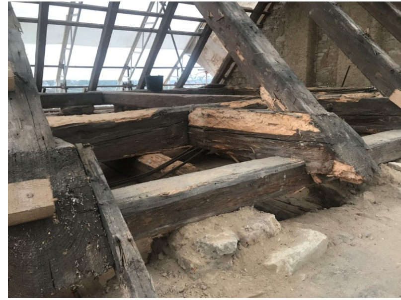
Kaple sv. Václava, odhalený krov, 2021.