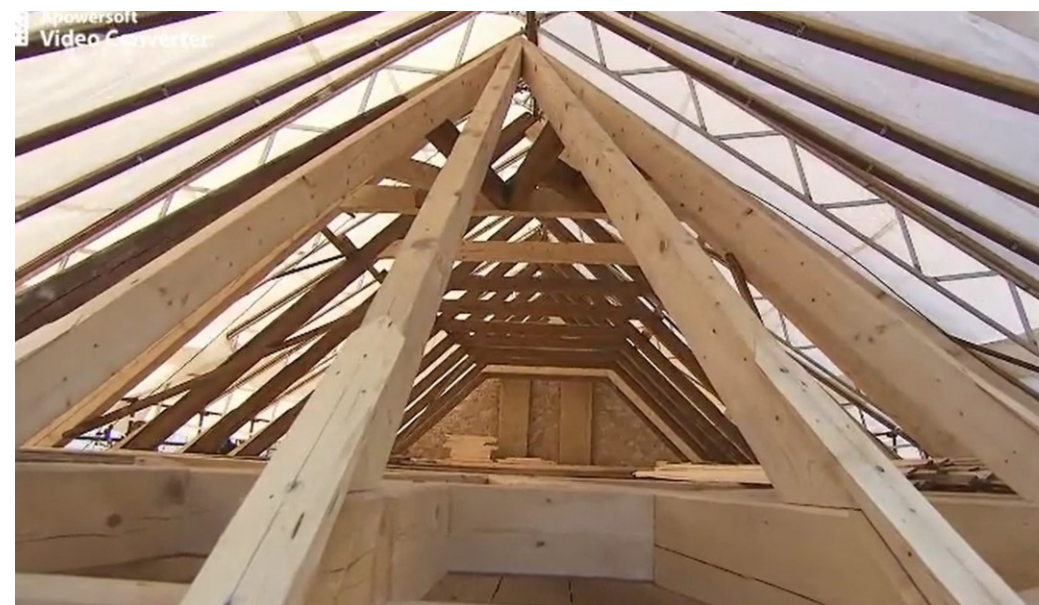
Kaple sv. Václava, nový krov, 2021.