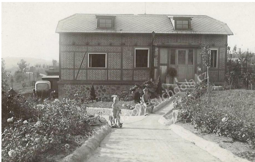
dům v ulici Třebízského v roce 1932 v době války (od r.1942) se jmenovala Langegasse dnes Stržná

Pan ředitel po nějaký čas přebýval v našem domě (tenkrát to byl víkendový dům) po dobu užívání základní školy německou armádou.